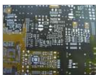
Gerade bei kleinen Serien oder exotischen Modellen gibt es keine Dokumentation. Hier soll das Reverse Engineering helfen.

Fehlt die Dokumentation oder ist das Board unzureichend dokumentiert ist es schwierig, ein Board zu testen oder zu fertigen. Hier hilft das so genannte Reverse Engineering beim Baugruppentest. Wir stellen Ihnen dieses Verfahren vor.